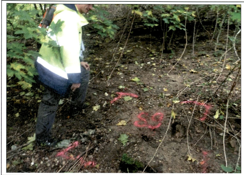
Bild 5. Ansatzpunkt S/RKS 89, Kleingartenanlagen