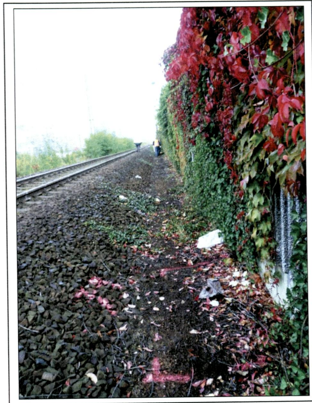
Bild 1. Ansatzpunkt S/RKS 79, Blickrichtung in aufsteigende Kilometrierung