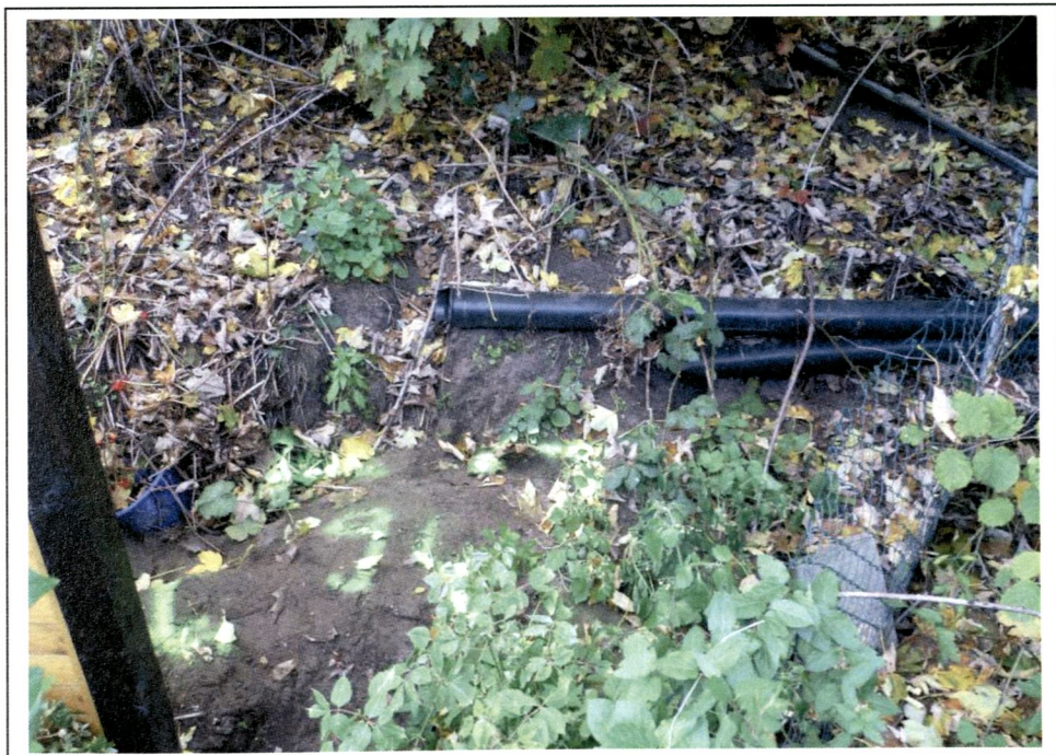
Bild 4. Ansatzpunkt S/RKS 94, Kleingartenanlagen.