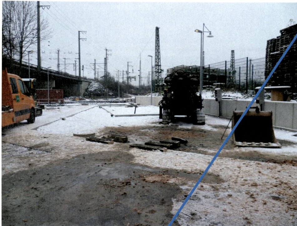
Bild 1. Bohrerät am Ansatz der Bohrung B 132 A