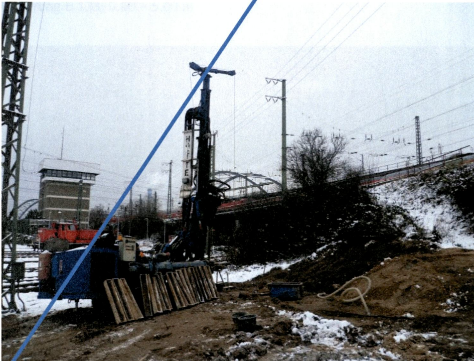
Bild 8. Bohrgerät am Ansatz der Bohrung 133