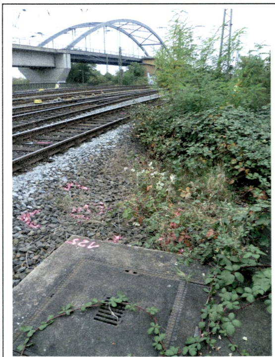
Bild 4. S/RKS/DPL-5 125