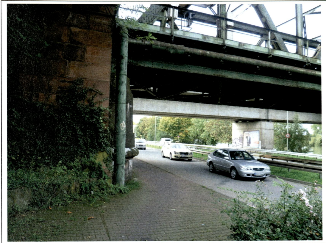
Bild 3. EÜ Mainbrücke, Widerlager Süd an Niederräder Ufer