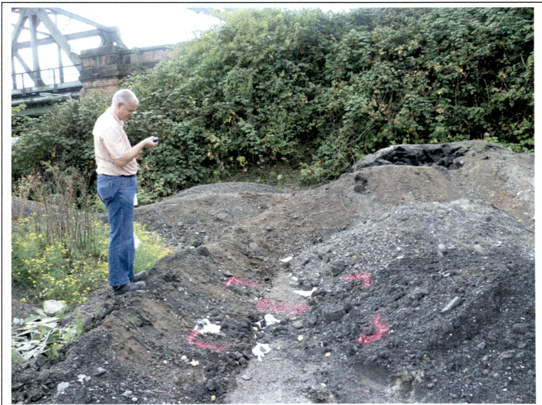
Bild 6. EÜ Mainbrücke, S/B/DPH 122, nördliches Mainufer