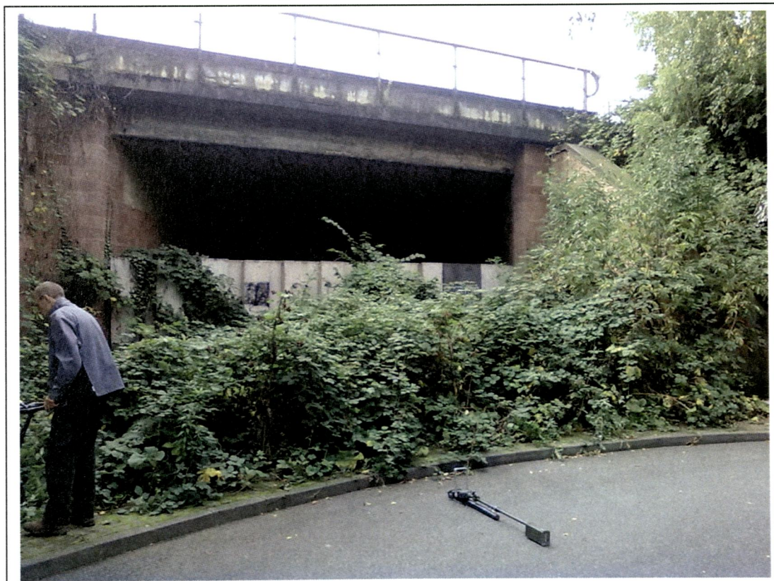
Bild 4. EÜ Mainbrücke, S/B/DPH 120, zugeschüttete EÜ gegenüber Wendehammer