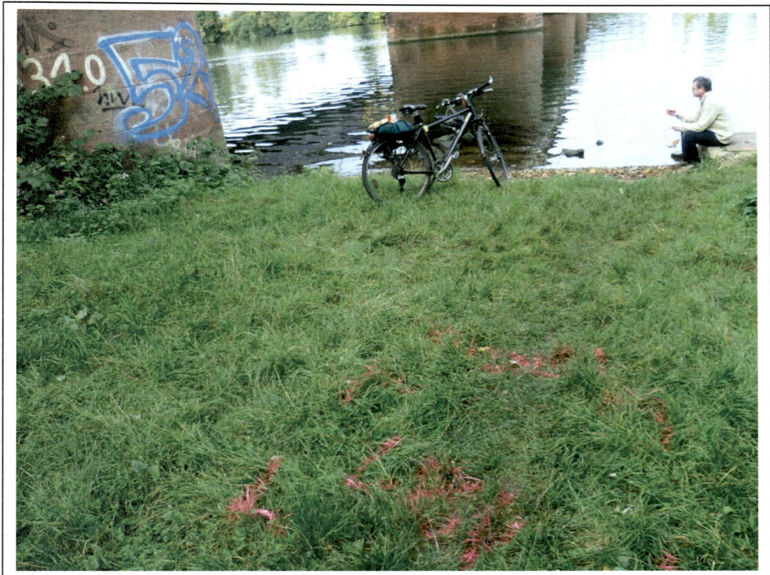
Bild 5. EÜ Mainbrücke, S/B/DPH 121, südliches Mainufer