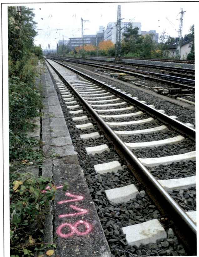
Bild 2. S/RKS/DPH 118, in Schrebergarten