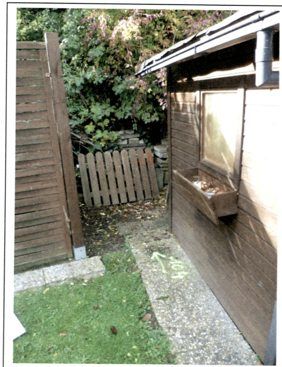
Bild 2. Ansatzpunkt S/RKS/ 104