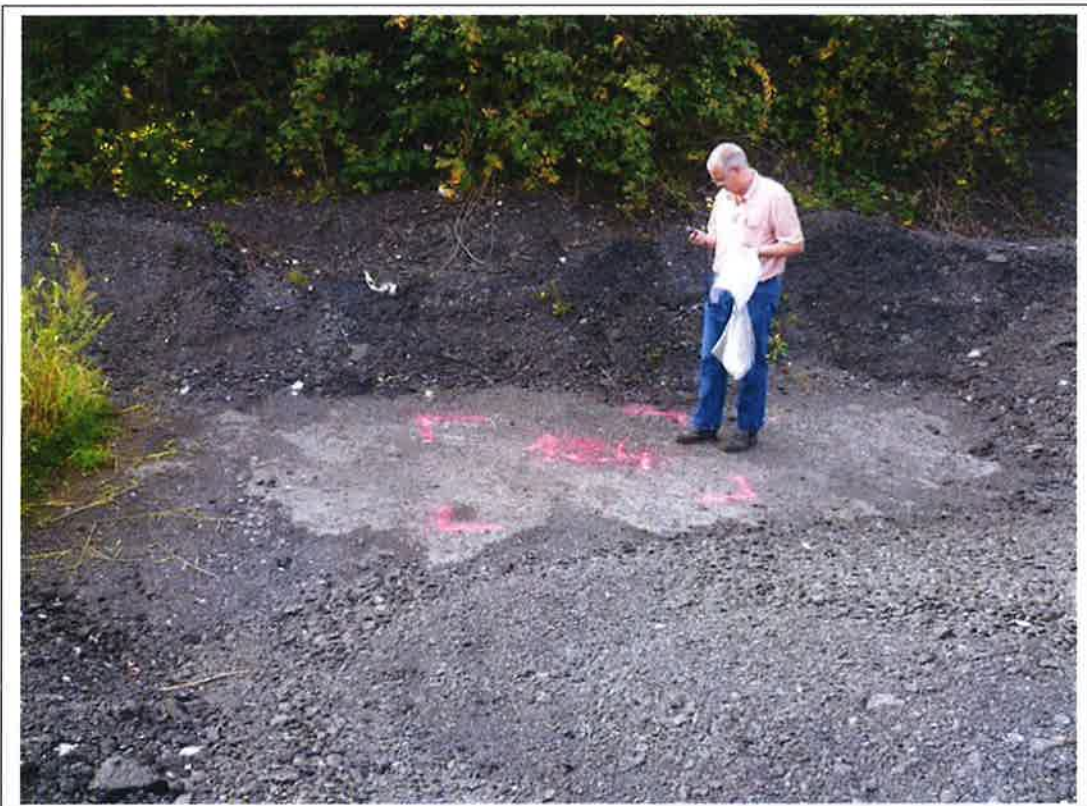
Bild 2. S/RKS/DPH 124, am Dammfuss des Bestandsdammes