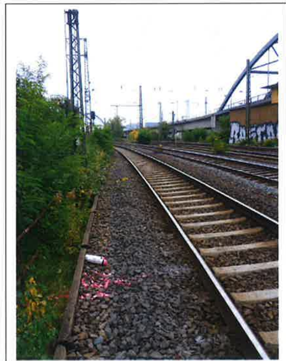
Bild 4. S/RKS/DPL-5 131 Damm gegenüber Fa-Stellwerk