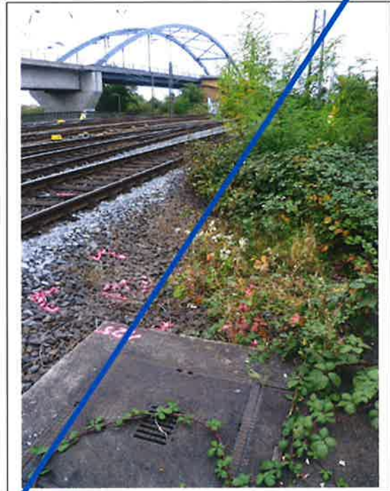
Bild 2. S/RKS/DPL-5 125 Damm, WL Süd Gutleutstraße