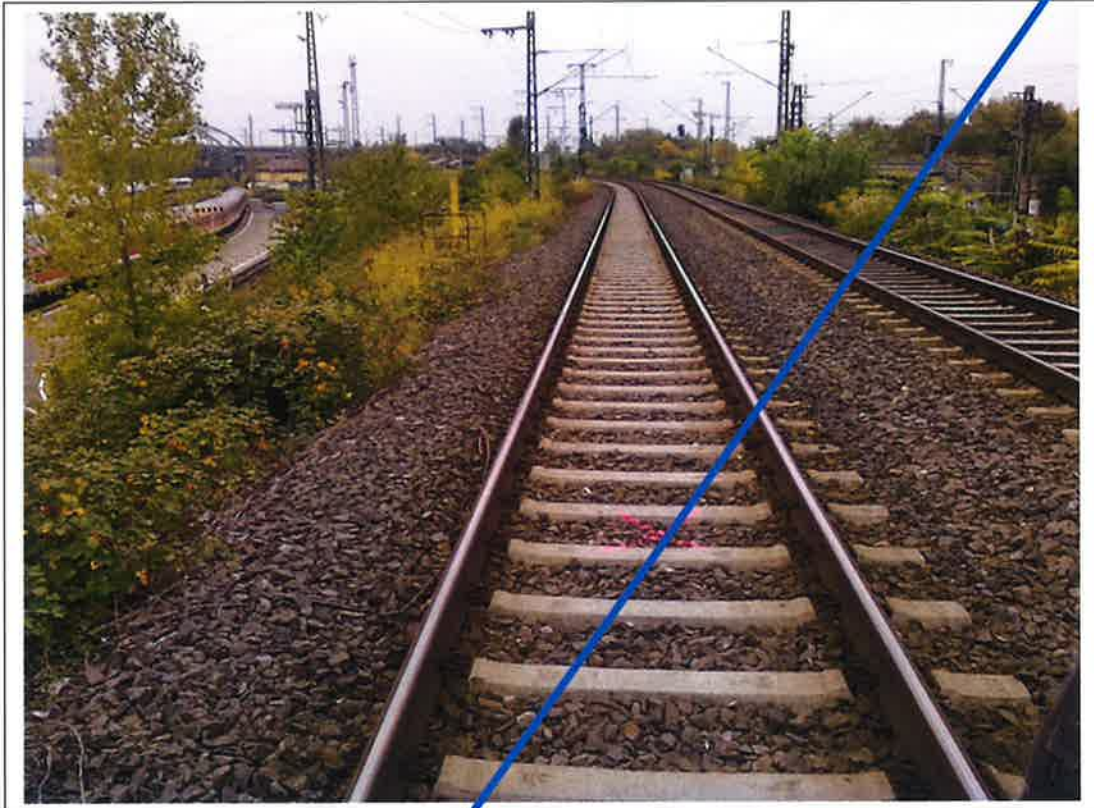
Bild 11. S/RKS 143, Damm Richtung Ffm Niederrad