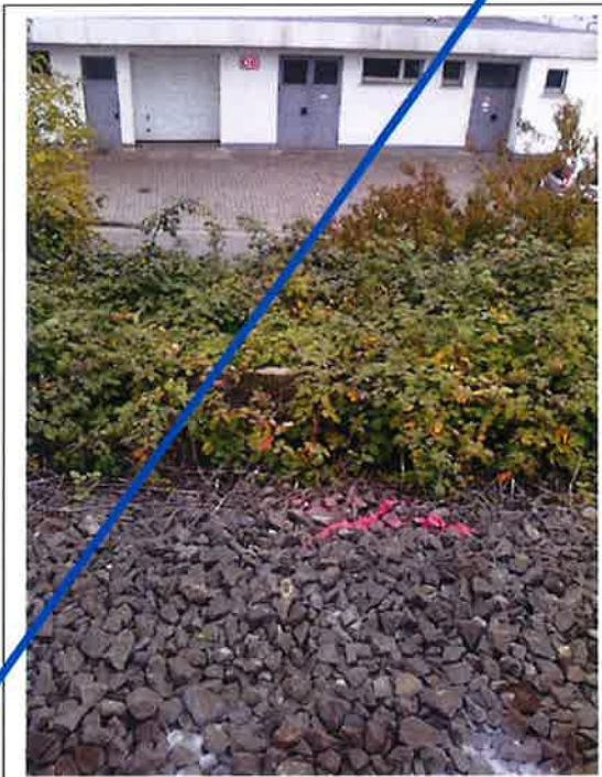
Bild 8. S/RKS/DPL-5 138 Damm an EÜ Ladestraße