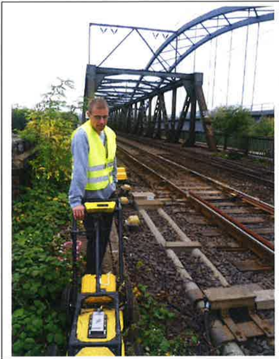
Bild 1. S/RKS/DPL-5 123 Damm, WL Nord bestehende Mainbrücke