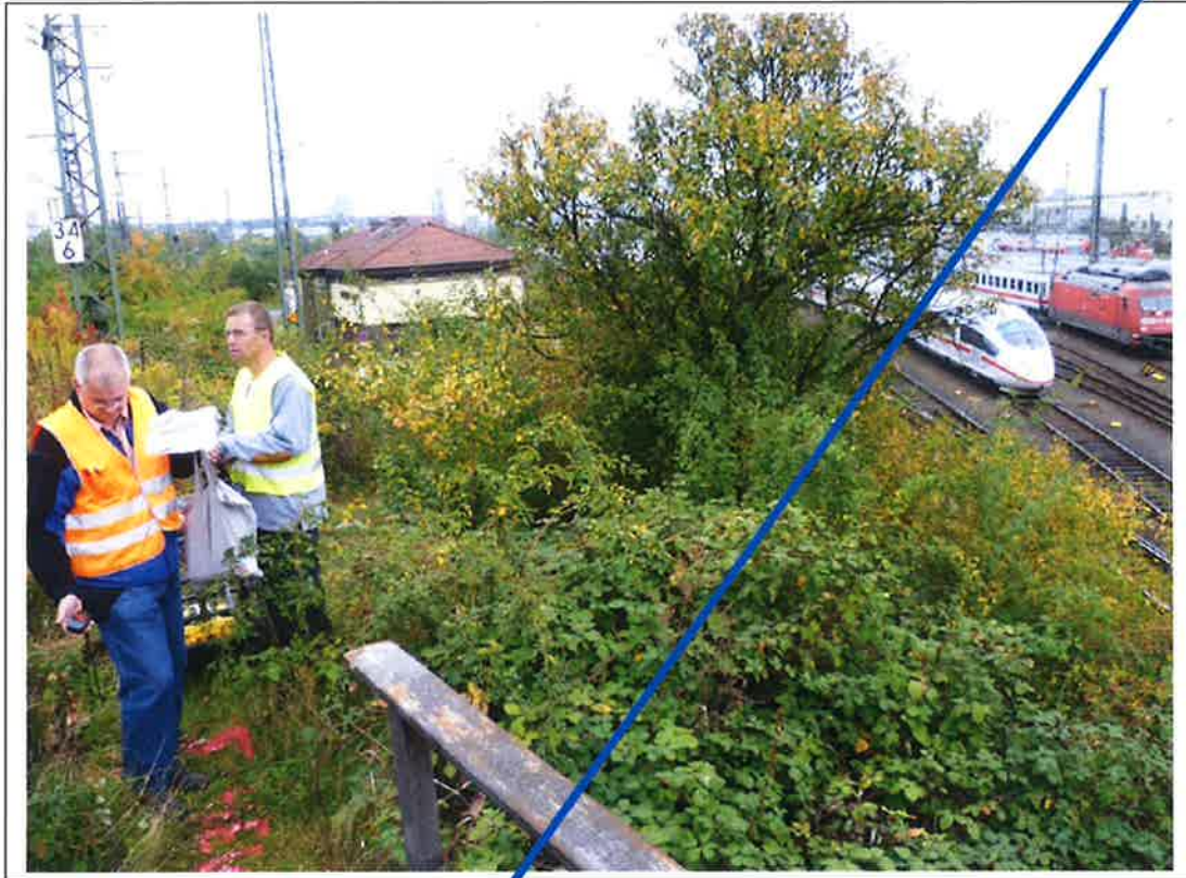
Bild 5. S/RKS/DPL-5 134, Damm Richtung Ffm Hbf.