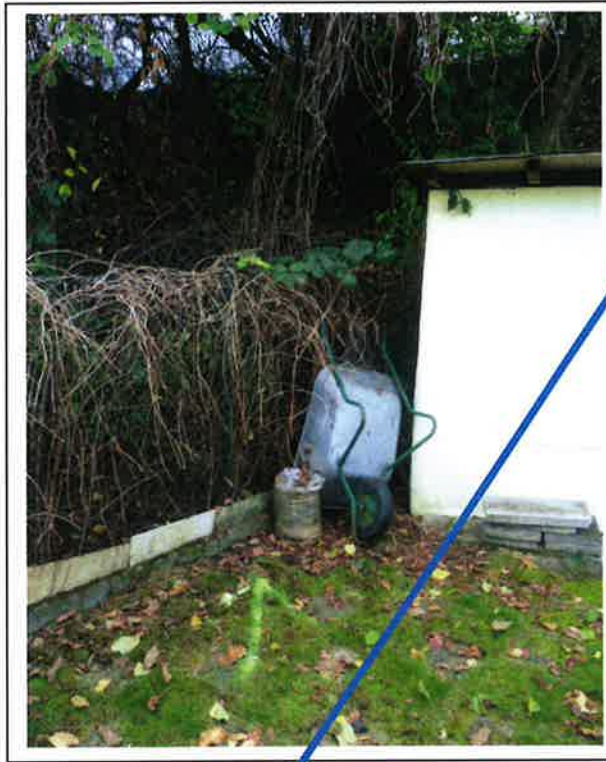
Bild 3. Ansatzpunkt S/RKS 106