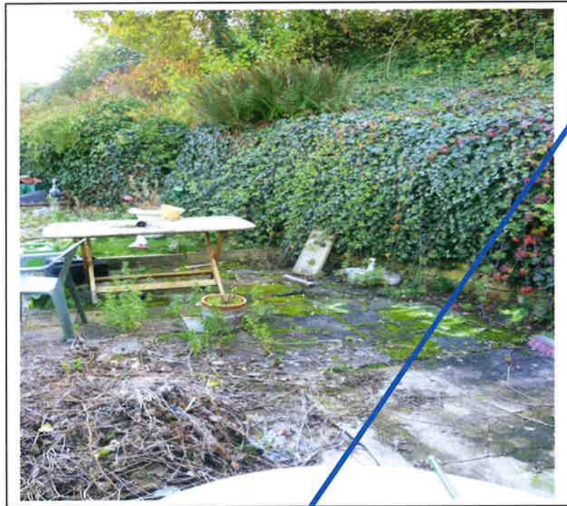
Bild 1. Ansatzpunkt S/RKS 102